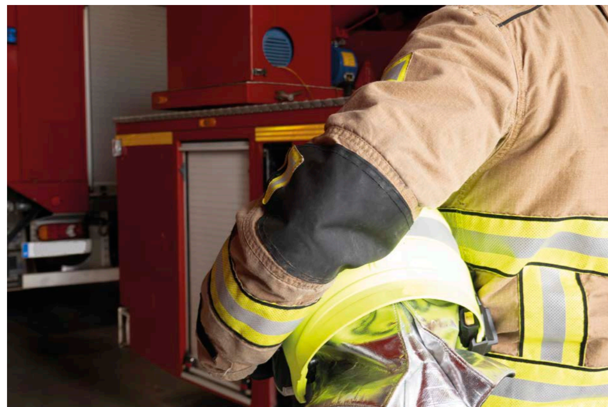
14. Subgrup de treball: prevenció, extinció d'incendis i salvament CNSST: "La seguretat i salut laboral del col·lectiu dedicat a activitats de prevenció, extinció d'incendis i salvament", 2023, p. 85-86.

Per a les emergències que puguin succeir en les labors de prevenció i extinció d'incendis forestals, s'ha d'articular un pla d'emergència en què es reculli la forma d'actuació en cadascuna de les emergències possibles. Cal identificar les persones involucrades en les brigades d'emergència, així com les seves funcions i competències.